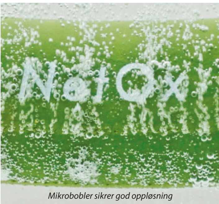
Mikrobobler sikrer god oppløsning

NetOx Net er et fleksibelt system som kan utformes etter merdenes geometri. Systemet kan leveres med automatisk regulering av oksygennivå.