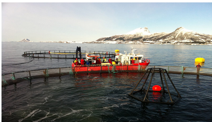
NetOx sikrer oksygentilgang, her under avlusing

NetOx Net sørger for gode oksygenforhold: • Merder i oksygenfattige farvann • Merder med skjerming mot lakselus/alger • Lukkede merder (post-smolt) • Slaktemerder • Nødoksygenering