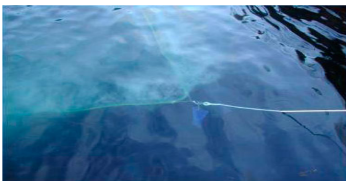
En melkeaktig sky av små bobler sikrer effektiv oppløsning